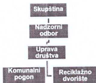
Slika 1. Shema organizacijske strukture

Dalibor Pešutić – član nadzornog odbora, imenovan Odlukom Općinskog vijeća dana 24. svibnja 2022. godine