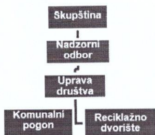
Slika 1. Shema organizacijske strukture

Dalibor Pešutić – član nadzornog odbora, imenovan Odlukom Općinskog vijeća dana 24. svibnja 2022. godine