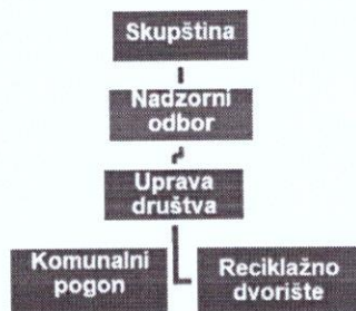
Slika 1. Shema organizacijske strukture

Dalibor Pešutić – član nadzornog odbora, imenovan Odlukom Općinskog vijeća dana 24. svibnja 2022. godine